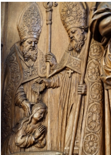
Le baptême de Ste Odile (décoration des stalles)