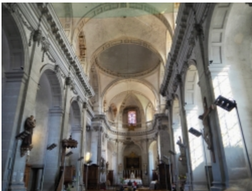
La magnifique abbatale de Moyenmoutier