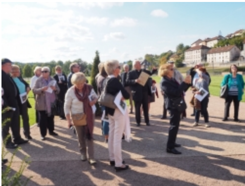
une partie du groupe